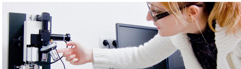
© Biomedicínske centrum Slovenskej akadémie vied