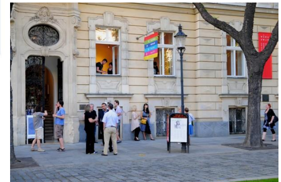
© Academy of Fine Arts and Design in Bratislava

Die Herausforderungen, die sich durch die Digitalisierung und rasanten technischen Fortschritt bilden, können lediglich durch Zusammenarbeit, besonders durch grenzüberschreitende, gemeistert werden. Die Forschung spielt in diesem Bereich eine ebenso wesentliche Rolle, wie der gemeinsame Austausch.